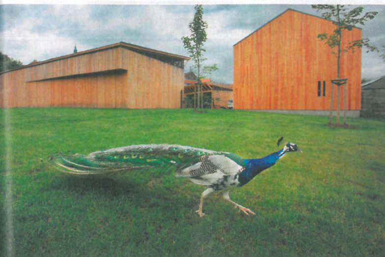
▲ ZAHRADNICTVÍ. Uspěť v soutěži Stavba roku mohou i drobnější hospodářské stavby, jakou je například zahradnictví v parku kroměřížského zámku.