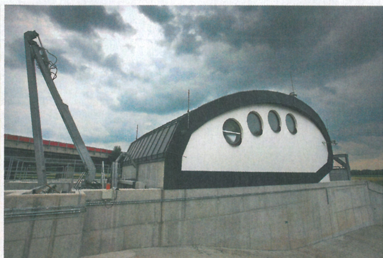
▲ SVIJANSKÁ KAPKA. Ne, to není nová značka svijanského piva, tvar kapky dostala nová elektrárna v obci.

lerie města Ostravy. Světlík totiž vyšel vstříc letitému hořekování radnice, že třetí největší město v republice nemá prostředky na vybudování reprezentačního domu pro výtvarné múzy.