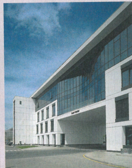
Lean Center (zaměstnanecké centrum), Mladá Boleslav, Václava Klementa 869, autoři Michal Ježek, Ivo Balcar, Aleš Krtička.

Kanadské velvyslanectví, Praha 6 , Ve Struhách 2, autoři Luboš Pata, Václav Frýdecký.